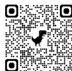
江の島サムエル・コッキング苑